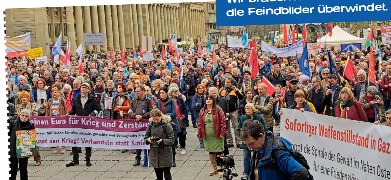
Ostermarsch 2024 in Stuttgart

Unsere gemeinsame Botschaft lautet: Nie wieder Faschismus. Nie wieder Krieg. Wir brauchen eine Politik, die Feindbilder überwindet.